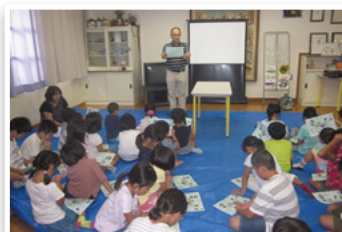
講話「保健所のお仕事紹介」