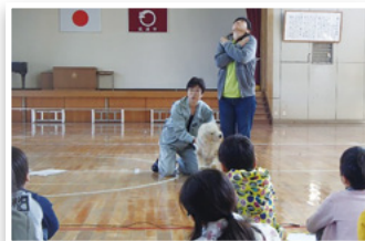
劇「知らない犬に出会ったら？」